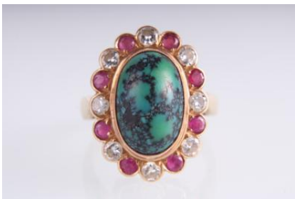
Gold 585, Rubine, rekonstruierter und/oder behandelter Türkis, RW 54, 5,6 gøg5