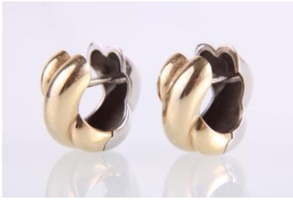
Gold/Weißgold 585, 8,6 gøg9