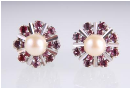
Weißgold 585, Rubine, Kulturperlen, 6,8 g øg6