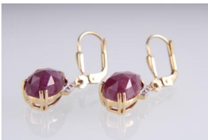
Gold 585, tlw. rhodiniert, Rubine, 4,3 gøg4