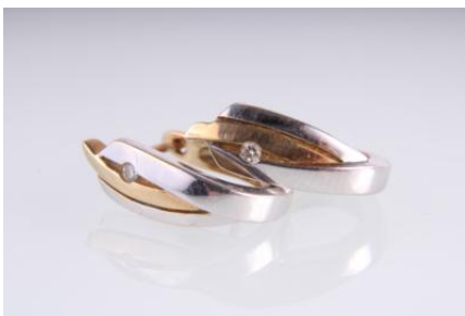
Gold 585, tlw. rhodiniert, 3,3 g øg5