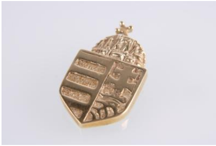
Gold 585, 3,4 gøg3