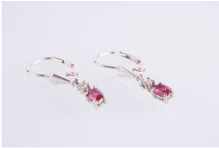
Weißgold 585, Rubine, 1,5 gøg1