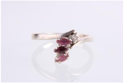
Weißgold 585, Rubine, RW 59, 3,1 gøg3