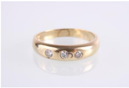
Gold 585, RW 53, 2,7 gøg3