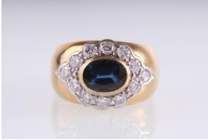
Gold/Weißgold 585, ein Saphir 1,60 ct (graviert), Brillanten zus. ca. 0,88 ct (graviert), RW 53, 7,3 gøg7