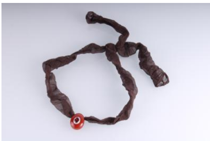
Gold 585, tlw. rhodiniert, Granat, Schmuckstein, auf Stoffband, 12,1 gøg1