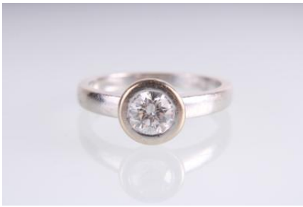
Weißgold 585, RW 54, 3,6 gØG4