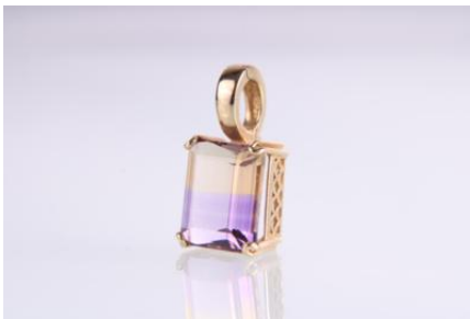
Gold 585, Ametrin ca. 3,8 ct, aufklappbares Collant, 2,4 g øg2