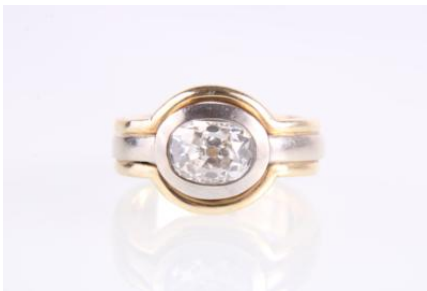
Gold/Weißgold 585, Diamant im Ovalschliff, tlw. mattiert, RW 55, 9,8 gØG10