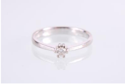
Weißgold 750, RW 53, 2,4 gøg2