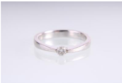
Weißgold 750, RW 49, 2,7 gøg3