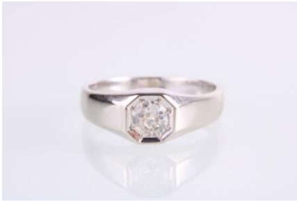
Weißgold 585, RW 58, 5 gøg5