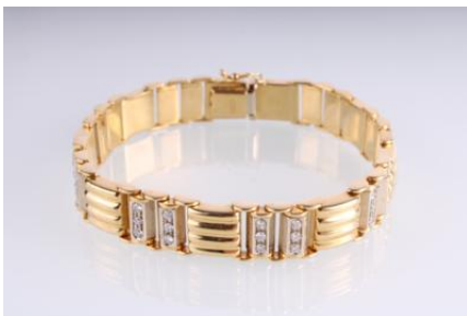
Gold/Weißgold 750, Länge ca. 19 cm, Steckschließe, Sicherheitsverschluss, 35,5 gøg36