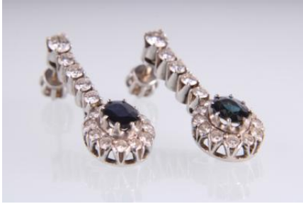
Weißgold 585, Saphir zus. ca. 1,20 ct, 5,9 gøg5