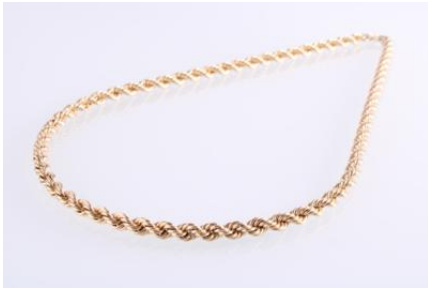
Gold 585, Länge ca. 43 cm, 10,5 gøg11