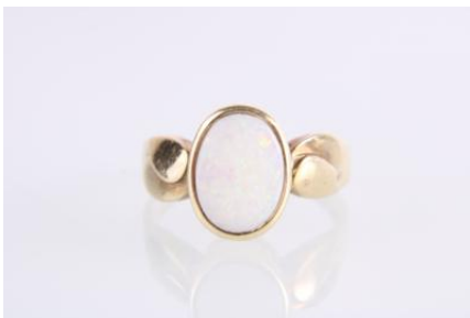
Gold 585, RW 51, 3,8 gøg3