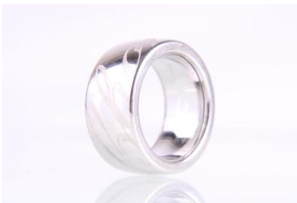
Weißgold 750, zweiteilig und beweglich, tlw. sandgestrahlt, RW 54, 21 gØG21