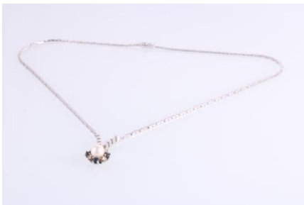
Weißgold 585, Saphire, Kulturperle, Länge ca. 45 cm, Steckschließe, Sicherheitsverschluss, 12,1 gøg12