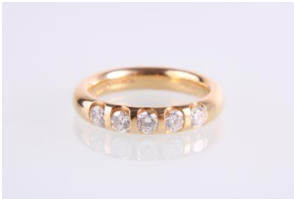
Gold 750, RW 55, 7,5 gøG8