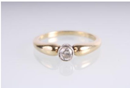
Gold/Weißgold 585, RW 55, 3,5 gøg4