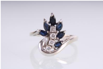
Weißgold 585, Sapphire, RW 55, 3,8 gøg4