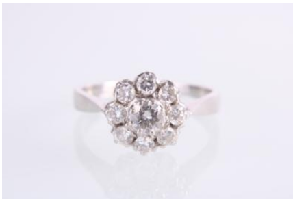
Weißgold 585, RW 55, mittlerer Brillant ca. 0,25 ct, 3,1 gøg3