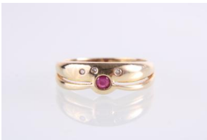
Gold 585, Rubin, RW 55, 3,1 gøg3