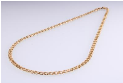
Gold 585, Länge ca. 50 cm, 23,5 gøg24