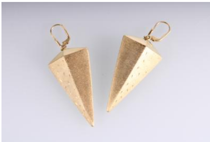
Gold 585, tlw. mattiert, 7,6 g øg8