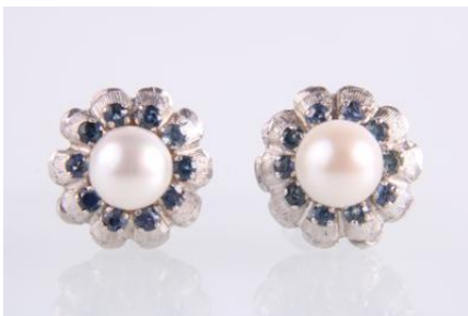
Weißgold 585, Sapphire, Kulturperlen, 5,8 g øg5