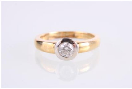
Gold/Weißgold 750, RW 53, 4,9 gøg5