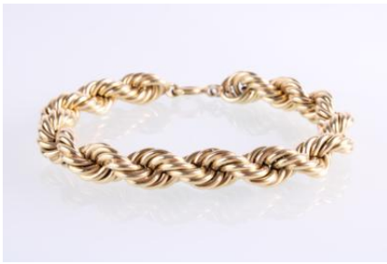
Gold 585, Länge ca. 19 cm, 13,7 gøg14