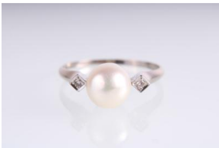
Weißgold 585, Kulturperlen, RW 53, 1,9 gøg2