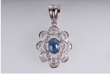
Weißgold 750, Saphir ca. 2,40 ct, 4,6 gøg4