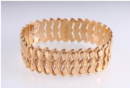
Gold 750, Länge ca. 19 cm, Steckschließe, Sicherheitsverschluss, 29,4 gøg29