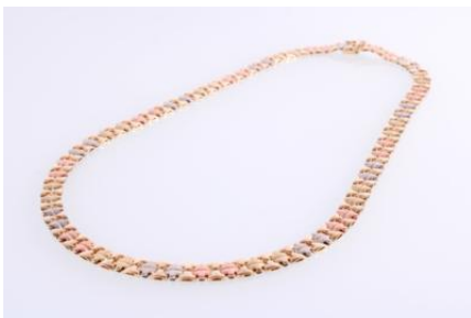
Gold 585, 3färbig, Länge ca. 45 cm, Steckschließe Sicherheitsverschluß, 21,5 g øg22