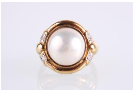
Gold 585, Kulturperle, RW 51, 6,1 gøg5