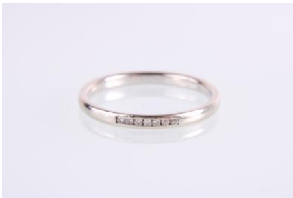
Weißgold 585, RW 55, 1,9 gøg2