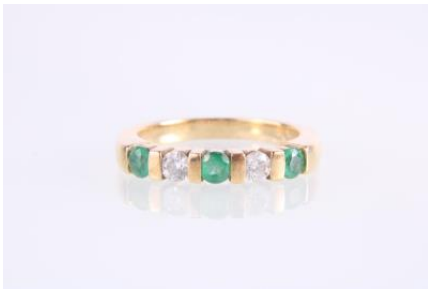
Gold 585, Smaragd, RW 53, 4,5 gøg4