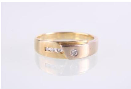
Gold/Weißgold 585, RW 56, 3,9 gøg4