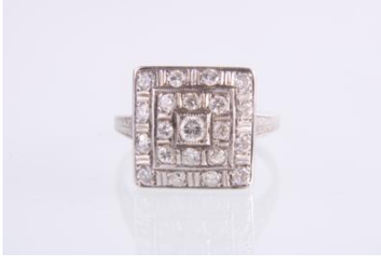
Weißgold 585, RW 51, 3,8 gøg4