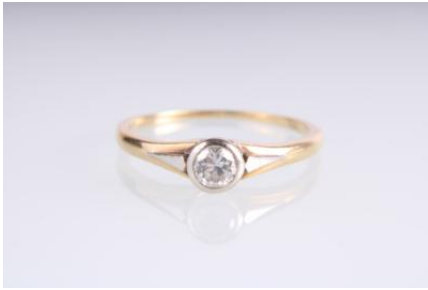
Gold/Weißgold 585, RW 54, 1,9 gøg2