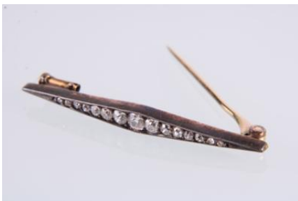
Gold 580, Altschliffdiamanten in Silberfassung, Länge ca. 45 mm, Arbeit erstes Drittel 20. Jahrhundert, 3,1 gøx