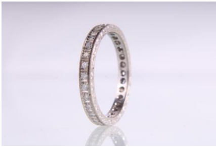
Weißgold 585, Brillanten zus. 0,62 ct, RW 66, 4,6 gØG5