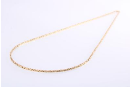
Gold 585, Länge ca. 60 cm, 14,4 gøg14