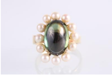
Gold 585, Kulturperlen, ein grün-gelber Saphir, RW 55, 6,4 g, Saphir ohne Anzeichen einer Erhitzungøg5