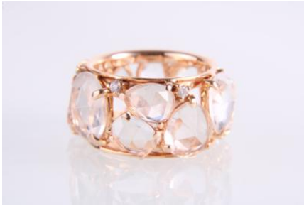
Gold 750, Bergkristall, RW 54,9,3 gøg8