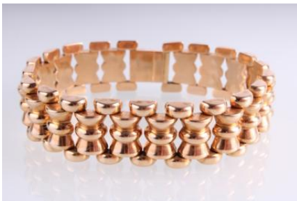
Gold 585, Länge ca. 19 cm, Steckschließe, Sicherheitsverschluss, 26,7 gøg27