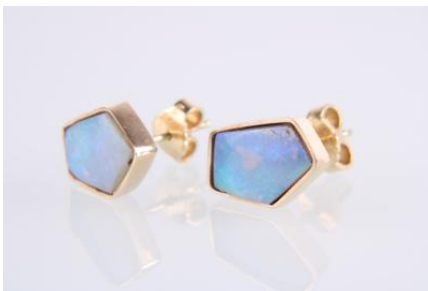
Gold 585, 3,9 gøg3